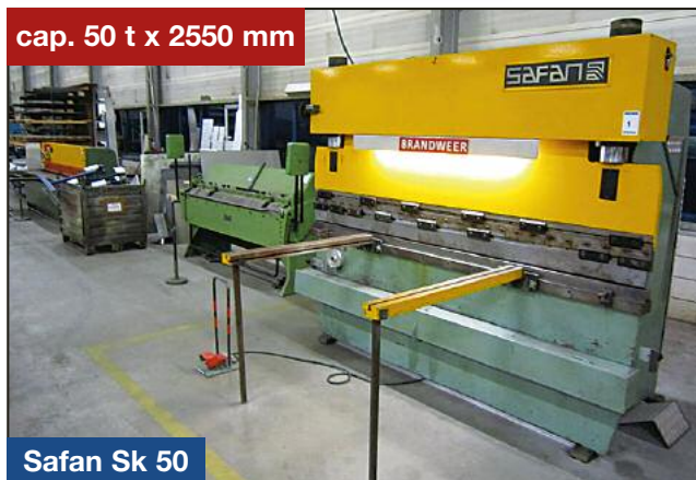
Safan Sk 50